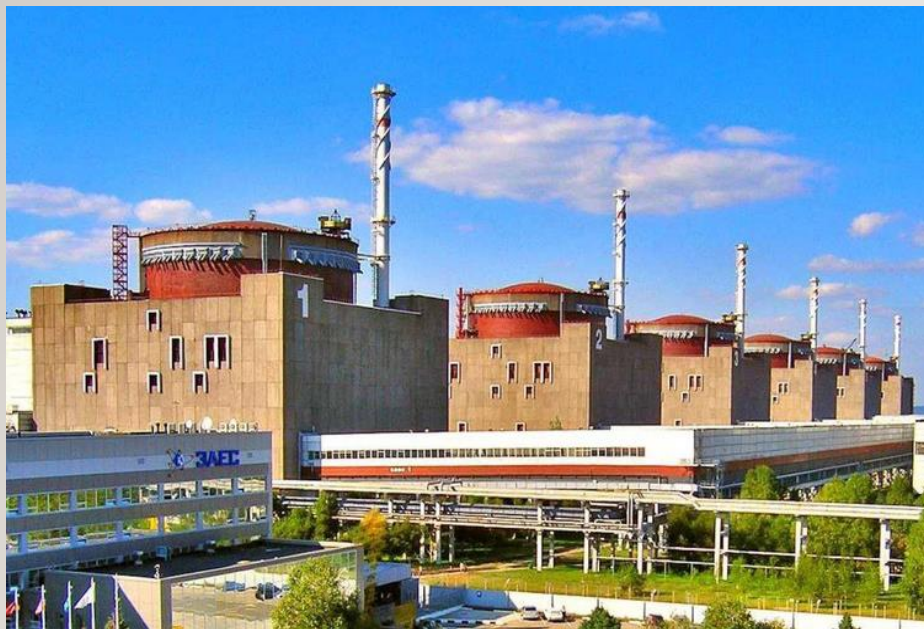
ЗОВНІШНІЙ ВИГЛЯД ЗАЕС